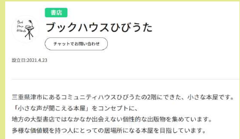
コミュニティハウス併設の本屋さん