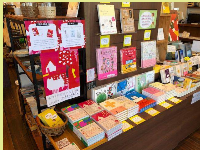
福岡市 ブックスキューブリック箱崎店さん (今日の人生シリーズ原画展も同時開催)