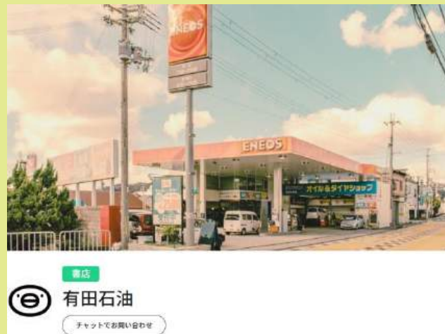
本を売るガソリンスタンドさん