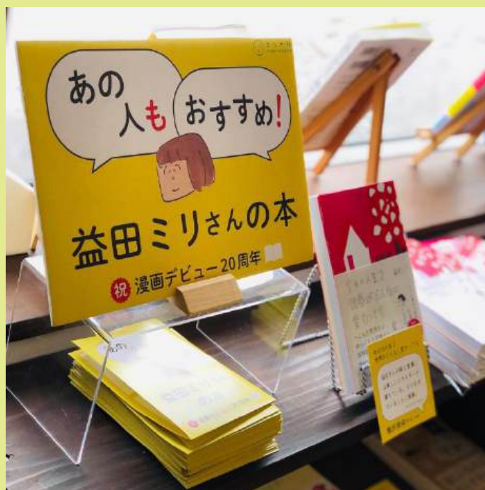
長崎市 本屋ウニとスカッシュさん (2021年2月OPEN)