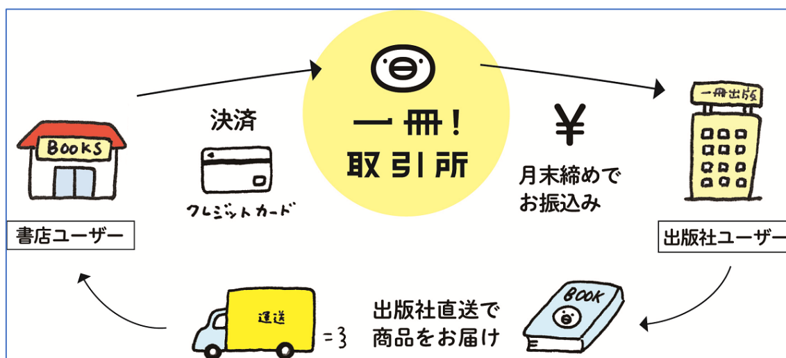
一冊！決済 サービス概念図

2022年1月17日(月)のリニューアル以降にサイト内で登録・設定すればご利用できます。